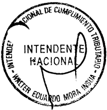
NAHIL LILIANA HIRSH CARRILLO Superintendente Nacional SUPERINTENDENCIA NACIONAL DE ADMINISTRACION TRIBUTARIA