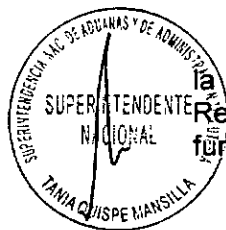
TANIA QUISPE MANSILLA Superintendente Nacional SUPERINTENDENCIA NACIONAL DE ADUANAS Y DE ADMINISTRACIÓN TRIBUTARIA